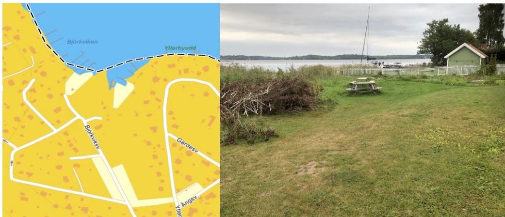
Bild Björkviken 2020

YBS & FYB vill att området är tillgängligt för Resaröborna och fortsätter att utvecklas.